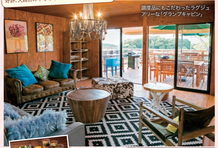
調度品にもこだわったラグジュアリーな「グランピングキャビン」

注目のグランピング(有料)は、テントタイプからキャビンまで多彩に揃い、さまざまなニーズに対応。ワンちゃんOKのサイトもあり、愛犬家からも好評。大自然の中でのキャンプやBBQも最高!