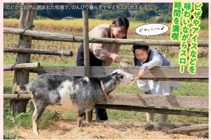
のどかな自然に囲まれた牧場で、のんびり暮らすヤギともふれ合える