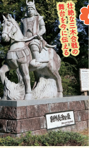
①上の丸公園にある別所長治公像